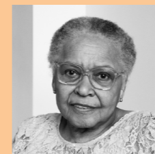
Gloria Ray Karlmark