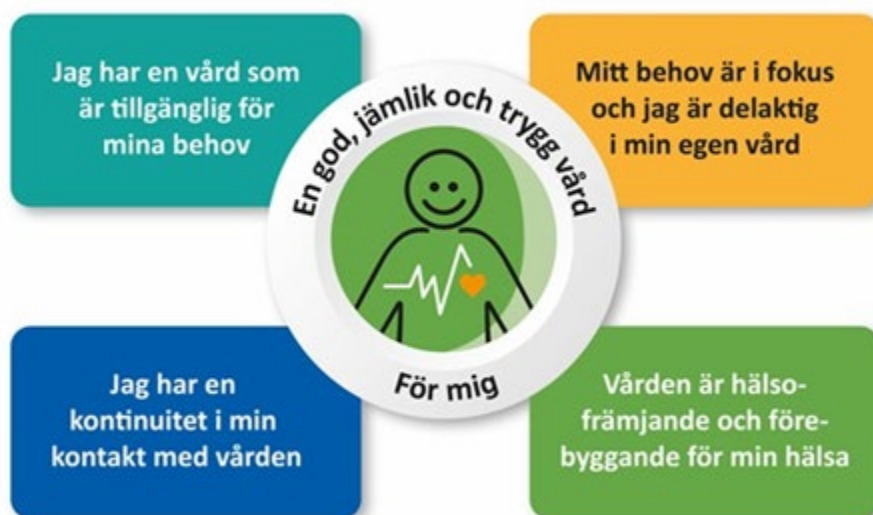
Figur 1. Länets målbild, en god och nära vård i Västernorrland 2030. Antagen av regionen och alla länets kommuner.

Länets vision och riktningssivare för omställningen är avsiktsförklaring god, jämlik hälsa och en nära vård och den länsgemensamma målbilden för god och nära vård i Västernorrland 2030, politiskt antagna av kommunerna och regionen gemensamt.